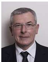
Jean-Pierre MEUR Maire de la ville